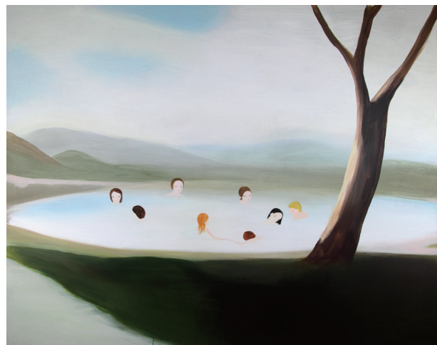
「水浴者 - Bathers」2009 年、アクリル / 亜麻布、128x160cm