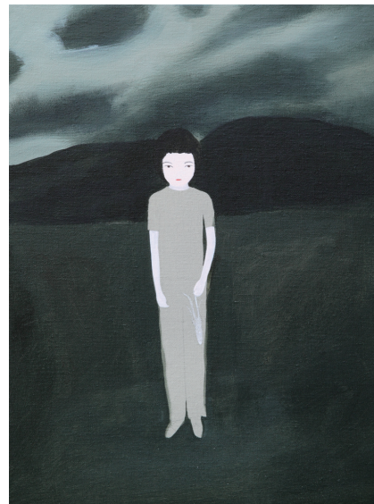
「夜釣り - Night fishing」 2009 年、アクリル / 亜麻布、55x42cm